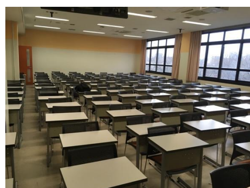
図 2 大教室ブロック（E308）の内観